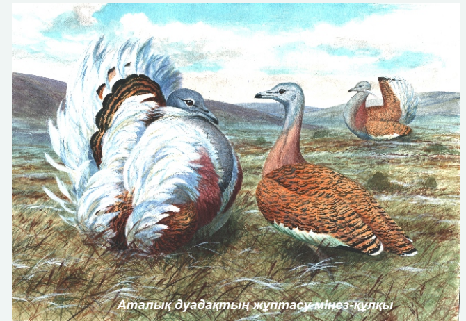
Аталық дуадақтың жұптасу мінез-құлқы

Қазіргі уақытта жер бетінде 30 мыңнан сәл астам дуадақ бар. Олар Пиреней түбегінде, Орталық және Шығыс Еуропа мен Азияда тіршілік етеді.