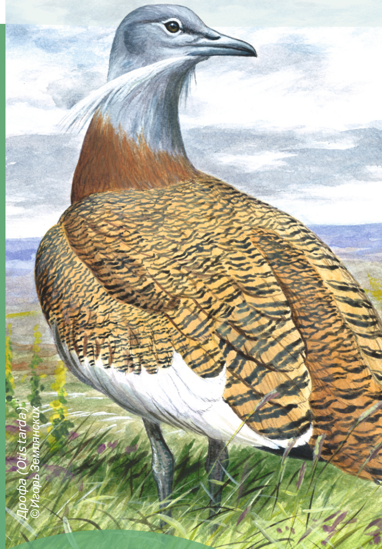
Дрофа (Otis tarda)